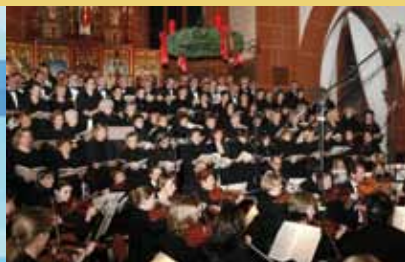
Dezember 2007 Aufführung des „Elias“ von Felix Mendelssohn-Bartholdy in der St. Matthiaskirche Nieder-Roden