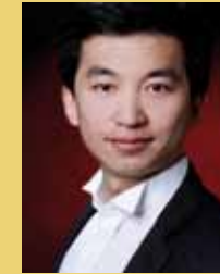
Yang Li, junger chinesischer Bariton,

1. Preis beim Bundeswettbewerb Gesang, Gastspiele in ganz Europa und Übersee mit schwierigsten Partien wie Königin der Nacht und Pamina, Mitglied der „Platin Scala“