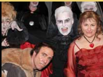
November 2010 Aufführung des Musicals „Tanz der Vampire“ im Bürgerhaus Nieder-Roden