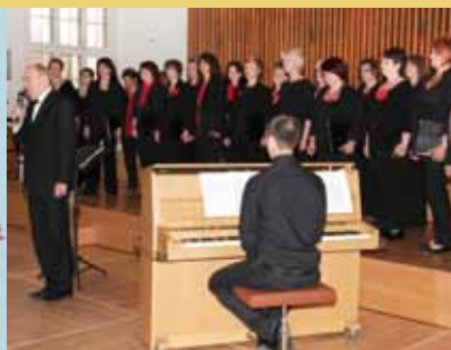
Juni 2012 Teilnahme am Internationalen Chorfest in Frankfurt am Main